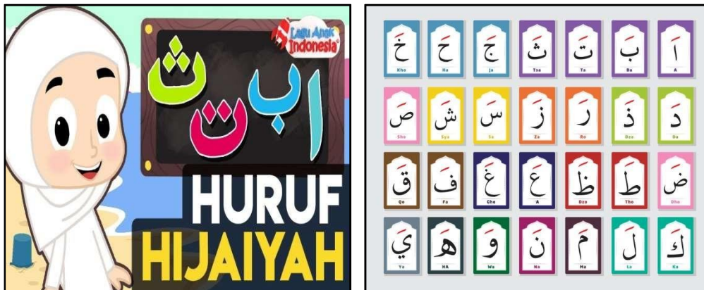
Gambar 2. Pengenalan Huruf Hijaiyah

Setiap jilid buku Iqro' memiliki tujuan yang berbeda-beda. Setiap volume diakhiri dengan Ebta untuk menentukan apakah siswa telah menguasai topik tersebut; mereka yang melakukannya dengan cepat menyelesaikan jilid Iqro mereka. Sebelum membaca huruf hijaiyah di buku Iqro, ustadzah terlebih dahulu mengenalkan beberapa huruf hijaiyah di papan tulis sekaligus cara membaca dan cara menuliskannya. Setelah mahasiswa memberi penjelasan kemudian mahasiswa mengarahkan agar para siswa mengambil buku tulis dan buku Iqro dan memberi tugas dengan menyalin buku Iqro ke buku tulis mereka sambil menunggu siswa bergantian membaca buku Iqro.