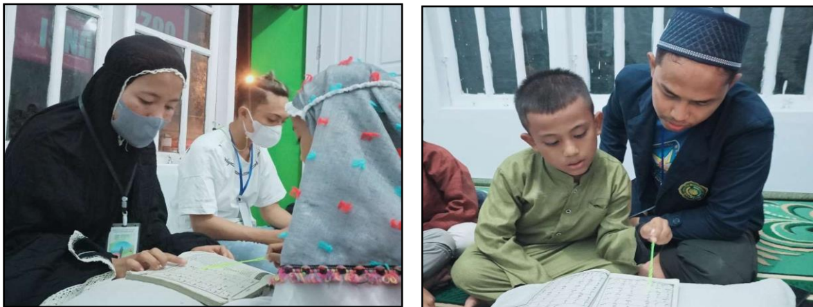
Gambar 1. Mengaji Dasar (Iqro)

Pelaksanaan Program Belajar Mengaji Al-Qur'an dalam menanamkan karakter Islami pada anak di MI Tarbiyatul Banin IV Desa Blumbungan Kabupaten Pamekasan Jawa Timur. Melakukan pengamatan terhadap letak sosial lingkungan, dan sistem nilai yang relevan di masyarakat yang bersangkutan merupakan langkah awal untuk menjadi mudah beradaptasi dan memposisikan diri secara efektif. Pelaksanaan kegiatan belajar mengaji Al-Qur'an dalam menanamkan karakter Islami pada anak di MI Tarbiyatul Banin IV Desa Blumbungan Kabupaten Pamekasan Jawa Timur, dalam rangka mengembangkan da'wah Islam di MI Tarbiyatul Banin IV Desa Blumbungan Kabupaten Pamekasan Jawa Timur. Pelaksanaan kegiatan ini, rutin dilakukan selama 3 kali dalam seminggu. Dilaksnakan pada hari senin, kamis, dan sabtu. Hal ini dimaksudkan agar efektifitas proses baca Qur'an dapat berjalan baik, dan dapat mengembangkan pengetahuan tentang penanaman karakter Islami.