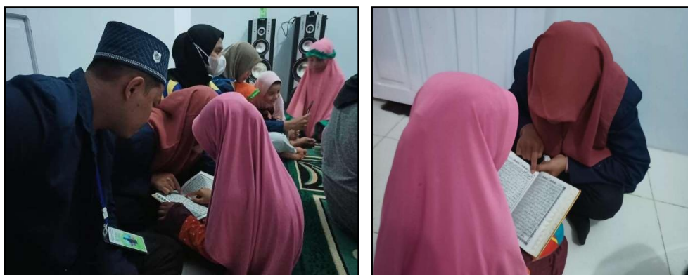
Gambar 3. Mengaji al-Qur'an

masing-masing, kemudian kembali ke tempat duduk masing-masing. Mereka kemudian dipanggil satu per satu, disuruh membaca buku Iqro, dan dibuatkan hafalan surat singkat. Setelah mengaji dasar anak di MI Tarbiyatul Banin IV Desa Blumbungan Kabupaten Pamekasan Jawa Timur, kemudian dilanjutkan dengan memanggil peserta yang sudah dapat mengaji al'Qur'an.